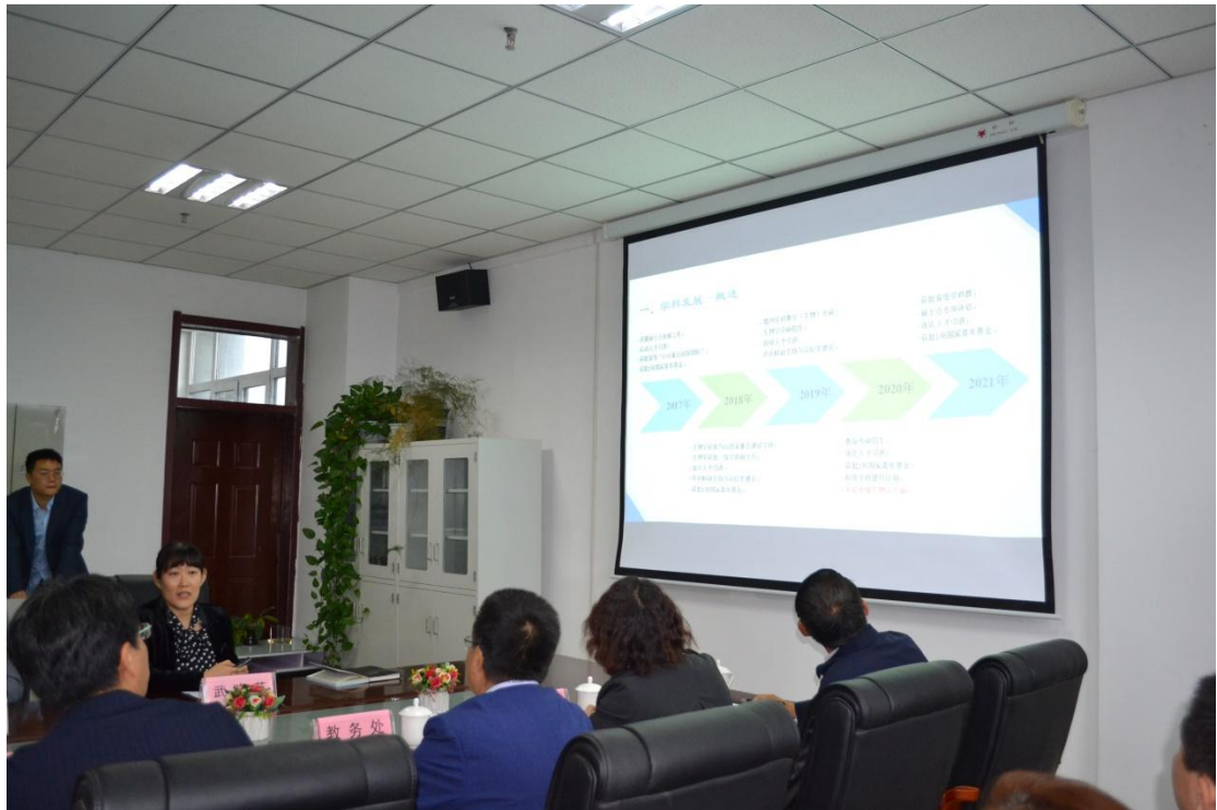
撰稿：王丹丹 审核：武晋斌